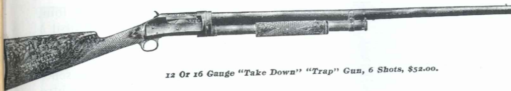
12 Or 16 Gauge "Take Down" "Trap" Gun, 6 Shots, $52.00.