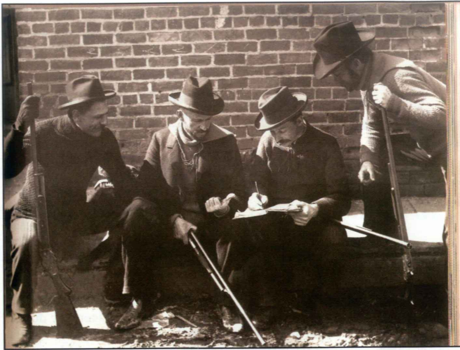
Cette équipe de tireur des années 1890 est équipée notamment d'un Winchester Mle 1887 à levier de sous-garde et d'un Winchester à pompe Mle 1897. Sur cette photo figurent John et Matt Browning.

effectuées à la suite d'un crime ou d'un délit commis avec une arme à feu. Il était donc nécessaire de soumettre à autorisation l'acquisition de ces fusils à pompe de moins de cinq coups, ceux qui ont une capacité supérieure à cinq coups étant déjà soumis à autorisation depuis 1995... »